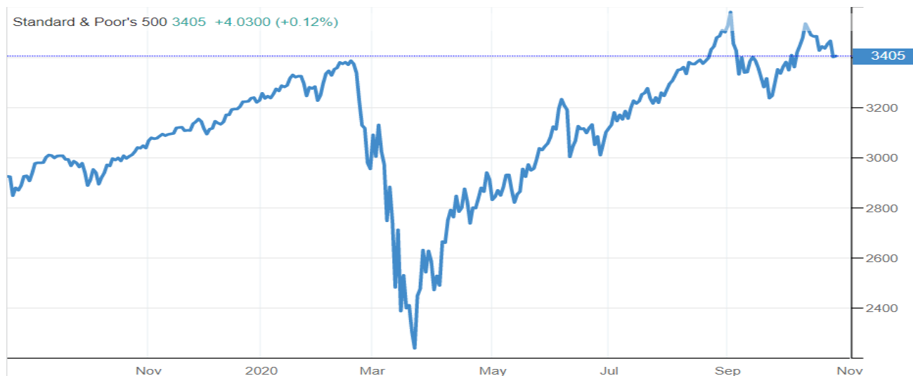
Pav. nr.1 Indekso SP500 pokytis per paskutinius 12 mėnesius

Praėjusią savaitę stiprėjant pandemijos padariniams indeksas SP500 krito daugiau nei 1 proc. punktu iki 3400 punkto lygio. Naujienos prieštaringos, tačiau akcijų kainoms kilti sunkiai sekasi. Labai tikėtina, kad panašios nuotaikos išliks ilgesnį laiką.