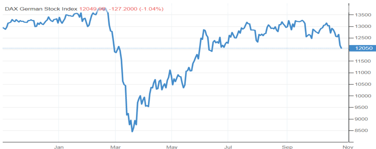
Pav. nr.3 Vokietijos akcijų indekso DAX pokytis per metus laiko.

Praėjusią savaitę taip pat buvo skelbiamos finansinės ataskaitos, kurių tarpe labai sužibėjo didžiausių bankų Europoje rezultatai. Bankai HSBC ir Santander paskelbė gerokai geresnius nei tikėtasi veiklos rezultatus – padėjo aktyvesnė nei įprasta prekyba vertybiniais popieriais bei klientų aktyvumas nekilnojamame turte. Nepaisant to, Europos akcijų rinkos sukosi žemyn. Pavyzdžiui Vokietijos akcijų indeksas DAX krito į dviejų mėnesių žemumas.