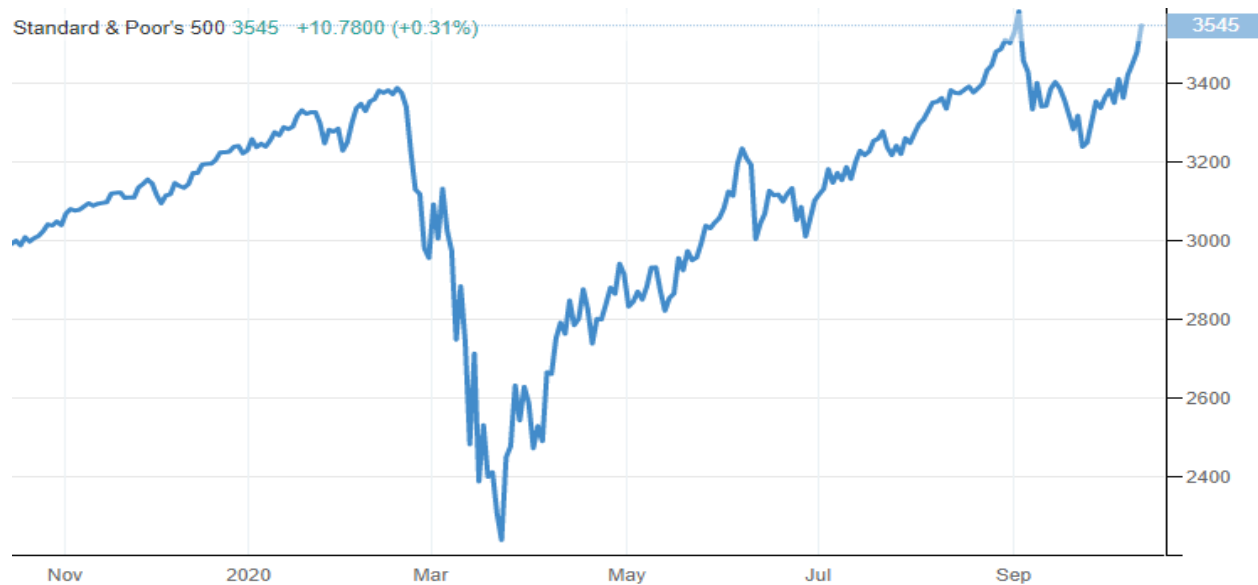
Pav. nr.2 Indekso SP500 pokytis per slenkančius metus.