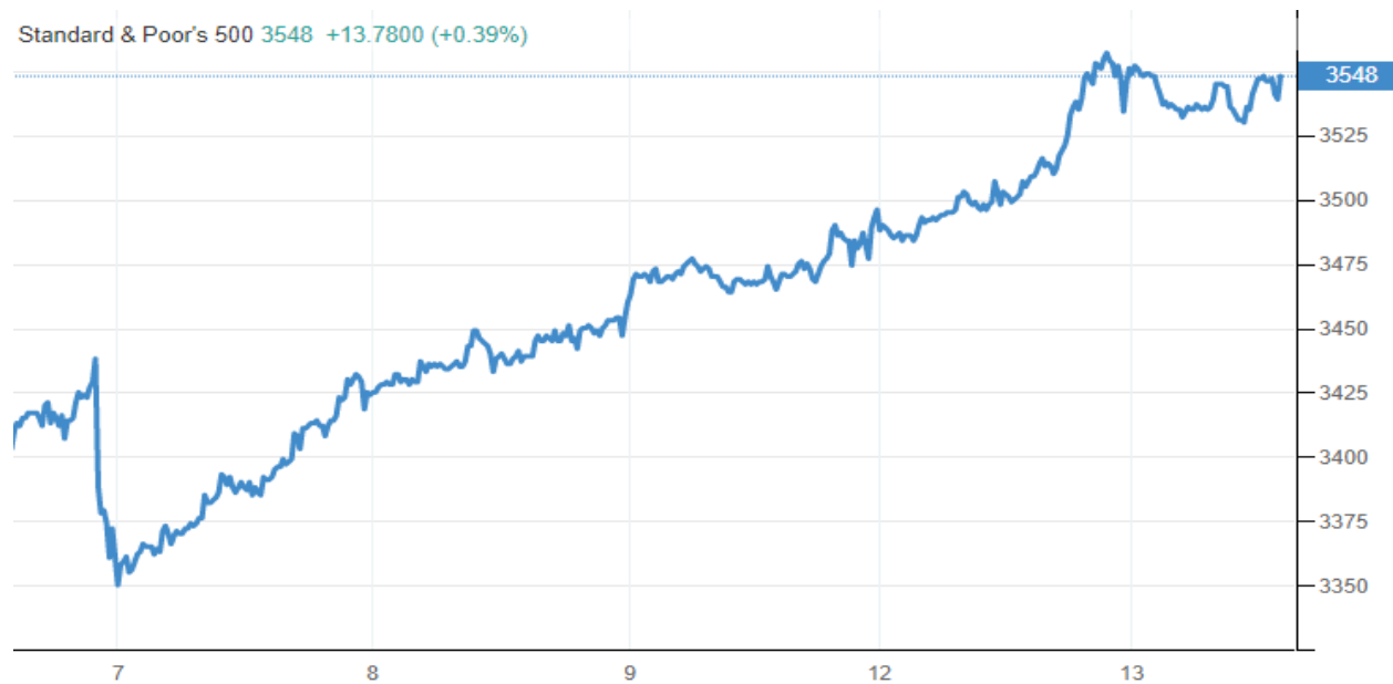
Pav. nr.1 Indekso SP500 pokytis per vieną savaitę.

Praėjusi savaitė finansų rinkose pasižymėjo nuosekliu optimizmu. Indeksas SP500 pakilo beveik 4 proc. ir augimas buvo itin nuoseklus. Daugėja teigiamų verslo nuotaikų ir tai skatina investuotojus elgtis drąsiau. Taip pat artėja ypatingai svarbūs JAV prezidento rinkimai, kurie gali pakeisti svarbiausios pasaulio ekonomikos mokestinę sistemą ir tolimesnį jos vystymąsi.