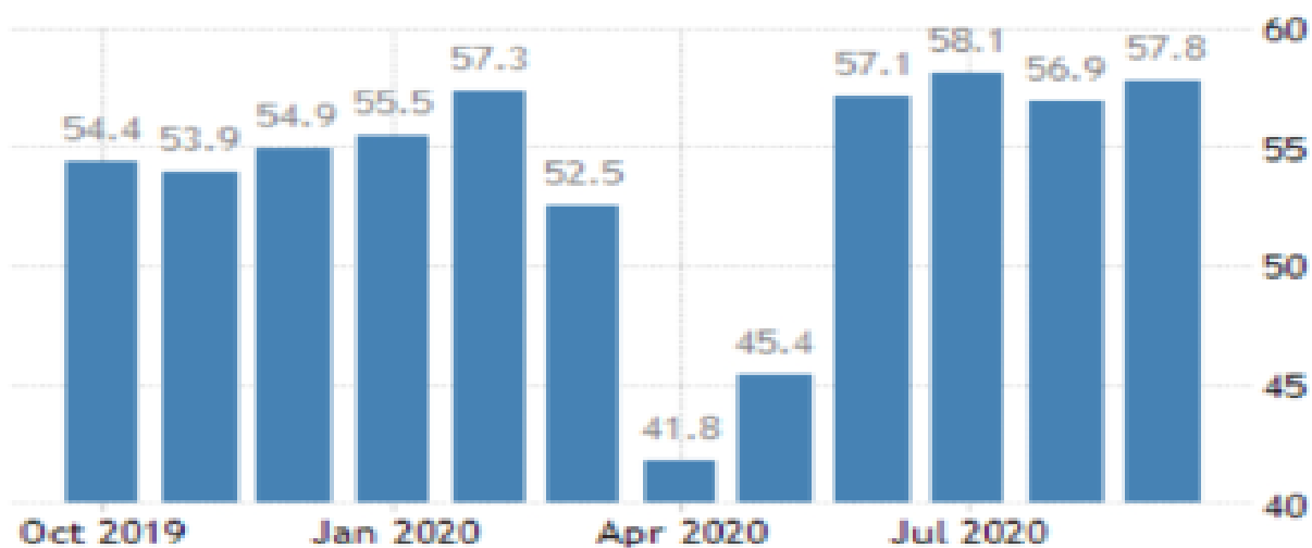
PAV.2 JAV paslaugų sektoriaus pasitikėjimo indeksas.

Taip pat labai geros naujienos pasiekė iš JAV. Didžiausios pasaulio ekonomikos paslaugų sektoriaus pirkimų vadybininkų pasitikėjimo indeksas rugsėjo mėnesį pakilo iki 57,8 punkto, kai buvo tikėtasi 56,3 punkto. Tai rodo, kad paslaugų sektorius nepaisant pandemijos yra linkęs sparčiai atsistatyti. Vartotojai jaučiasi komfortiškai ir sektorius atsigaudinėja. Pasitikėjimo rodikliai yra lyderiaujantys ir parodantys kokios nuotaikos gali būti po pusmečio bendrai ekonomikoje.