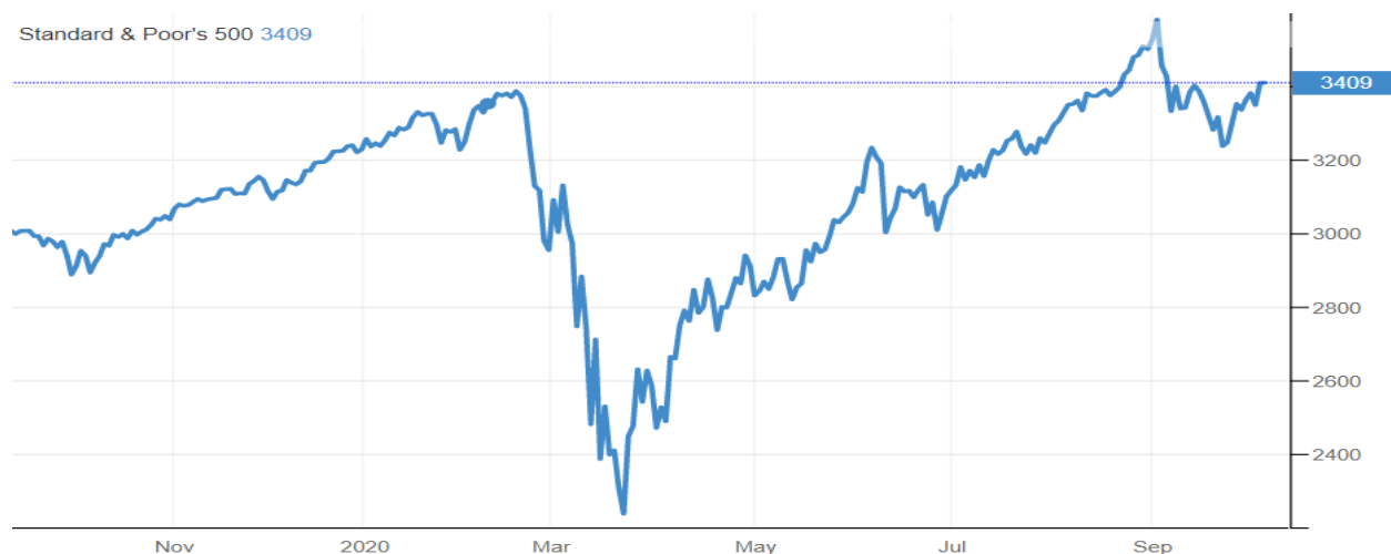
Pav. 3 indekso SP500 pokytis per metus laiko.

Tokios ir panašios teigiamos naujienos lemia, kad investuotojai jaučiasi komfortiškai. SP500 indeksas vėl bando šturmuoti aukštumas.