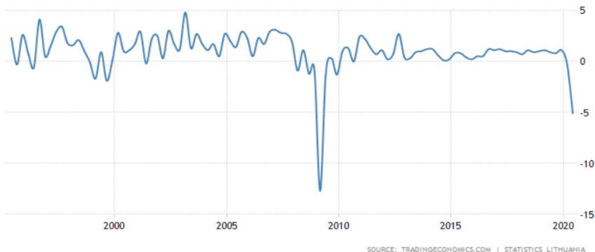
3 pav. Lietuvos BVP pokytis

Tuo pat metu Euro zonos ekonomika traukėsi 12 proc. ir šiame kontekste mūsų šalis narė Lietuva su 5 proc. susitraukimu atrodo tikrai įspūdingai. Bent kol kas kreivė neatrodo tokia aštri kaip 2009 metų krizėje.