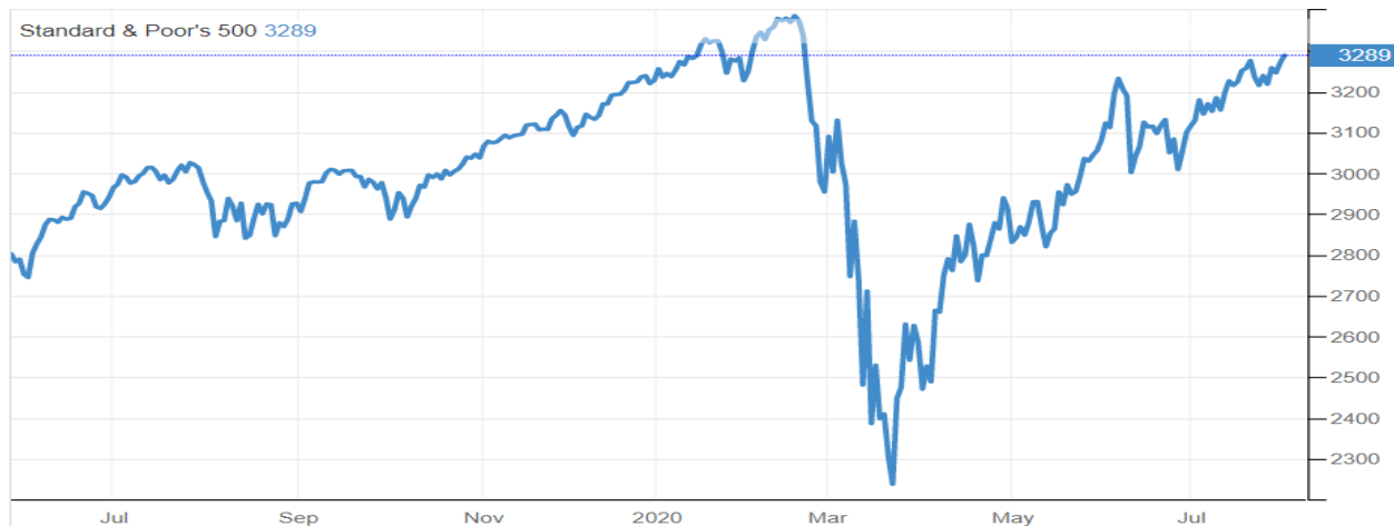
1 pav. SP500 pokytis per paskutinius 12 mėnesių

Bendro vidaus produkto rodikliai, kurie kalba apie praeitį rodė prastą situaciją, o pasitikėjimo rodikliai, kurie kalba apie ateities pokyčius, rodė stiprų pagerėjimą ir žmonių gebėjimą prisitaikyti prie grėšiančių viruso pavojų. Tokio naujienų kokteilio rezultatas – pagrindinis JAV akcijų indeksas SP500 pakilo 2 proc. ir priartėjo prie 3300 punktų ribos, už kurios iki visų laikų aukščiausio taško beliktų mažiau nei 3 proc.