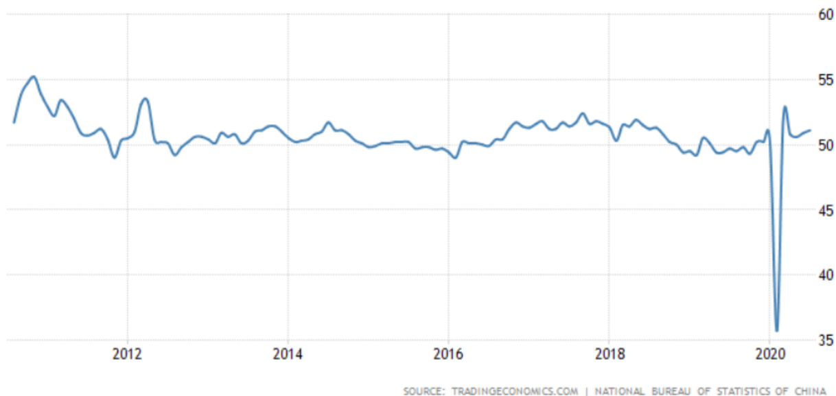
5 pav. Kinijos gamintojų PMI indeksas per dešimtmetį.

Neigiamas naujienas įveikė Kinijos pranešimas apie padidėjusį šios šalies gamintojų pasitikėjimo indeksą. Analitikai tikėjosi, kad jis žemės nuo 50,9 iki 50,7 punktų, tačiau jis netikėtai išaugo iki 51,1 punkto taip iššaukdamas pagyvėjimą rinkoje.