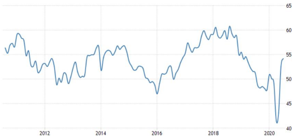
6 pav. JAV gamintojų pasitikėjimo indeksas.

Taip pat nuostabą sukėlė ir JAV gamybos sektoriaus pasitikėjimo indeksas, kuris pakilo 54,2 punkto, kas buvo gerokai aukščiau rinkos lūkesčių. Tai rodo, kad verslas mato galimybes įveikti viruso pasekmes ir išmokti gyventi su milžinišku susirgimų skaičiumi. JAV ekonomika pirmauja pasaulyje tiek pagal savo dydį, tiek pagal COVID-19 viruso atvejų skaičių.