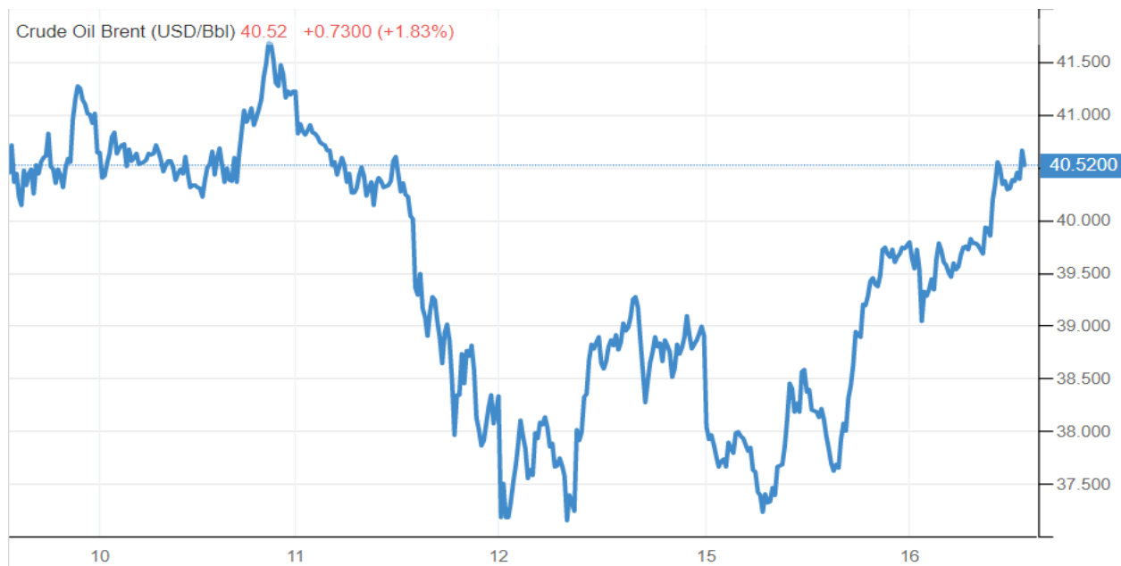
PAV.4 BRENT naftos kainos pokyčiai per savaitę.