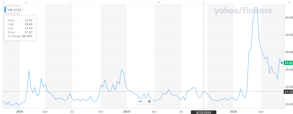
Pav.3 VIX indekso pokyčiai.

Šios problemos taip pat atsispindėjo ir svyravimo indekse, kuris atspindi baimes. VIX indeksas vėl kilstelėjo link 34 punktų, kas rodo, kad su 60 proc. tikimybe SP500 indeksas per artimiausią mėnesį gali svyruoti +/-3,5 proc. ribose.