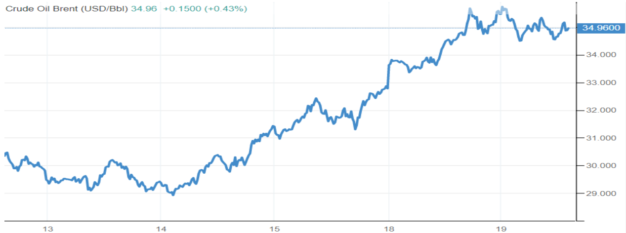
Pav.1 BRENT naftos kainos pokytis per savaitę, Šaltinis: www.tradingeconomics.com

Per praėjusią savaitę finansų rinkos nepasistūmėjo niekur (SP500 indekso atveju) arba fiksavo nedidelį augimą (Vokietijos akcijų rinkos atveju). Baimės indeksas VIX nusileido žemiau 30 punktų. Nepaisant ganėtinai vangios akcijų rinkos, didesni pokyčiai buvo fiksuoti žaliavų rinkoje ir visų pirma naftos prekyboje, kur BRENT rūšies naftos kaina per savaitę pakilo apie 15 proc. iki beveik 35 JAV dolerių už barelį.